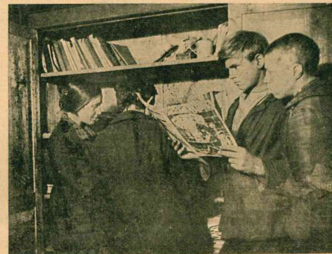
Машинистка выдает крестьянам книги из библиотеки.