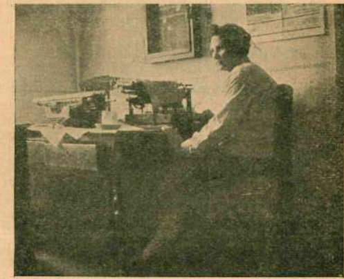
В проходной комнате... (Винница, Промсоюз)

В Горсовете, где машинисток тоже посадили, как зверей, в маленькую клетку (правда, обещают перевести в другую комнату), когда я пришла, один сотрудник диктовал машинистке. Приходит другой сотрудник и говорит, что в экстренном порядке ему тоже надо продиктовать большой доклад. На указание старшей машинистки, что «по инструкции исключается диктование одновременно несколькими», первый сотрудник, видимо причастный к администрации, сурово изрек: «как это нельзя? Об этом безобразии мы поговорим». Старшая в ответ за-