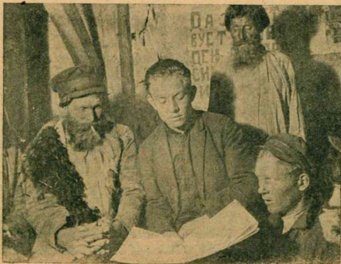
Машинист беседует с крестьянами о военном севе