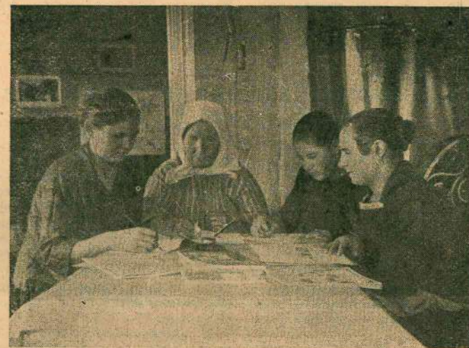
Машинистка обучает крестьянок грамоте на ликпункте