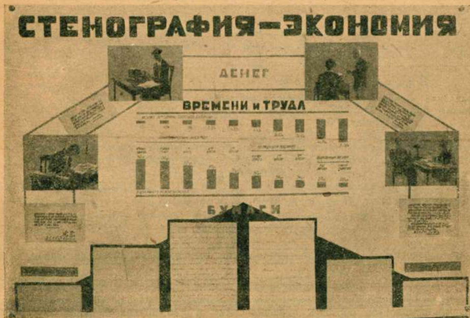
Один из плакат в стенографического уголка на выставке комсомола, „Новая письменность народов СССР“.

Приведенными примерами далеко не исчерпываются многообразные случаи плодотворного применения копировального метода на практике. Однако, сказанного вполне достаточно, чтобы осознать то огромное значение, которое имеет копировальный метод в деле углубления и расширения машинописного труда.