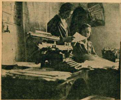
Машбюро на кухне (Винница, Хлебосоюз)

Вот вам неувязка между жизнью и инструкциями, предусматривающими улучшение условий работы машинисток.