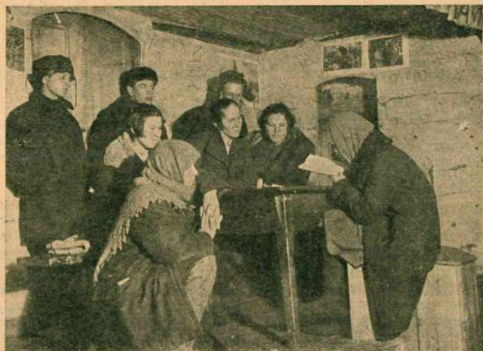
Крестьяне под руководством машинистки разучивают пьесу