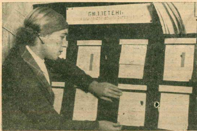
Вывешивание бюллетеня о ходе соцсоревнования в Центросоюзе.