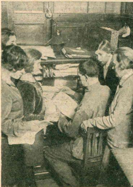
...Так происходила раздача работы в машбюро Центросоюза до соцсоревнования (см. стр. 20).

Если же его хозяйственные возможности или условия глухой местности не позволяют ему организовать рациональную эксплуатацию вводимой машины, то он должен временно отказаться от нее совсем, но не делать козлом отпущения ни в чем неповинную машинистку. Тогда и в этой области у нас не будет больше априорно виновных «стрелочников».