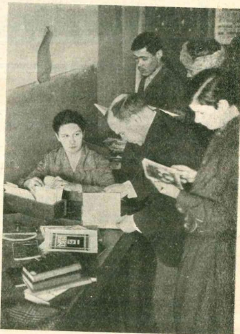
Тов. Стадлер за выдачей книг.

Когда, попав в Центросоюз, я изъявила желание поговорить с какой-нибудь машинисткой-активисткой, мне ответили хором: