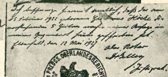
Самый молодой стенограф (см. стр. 29).