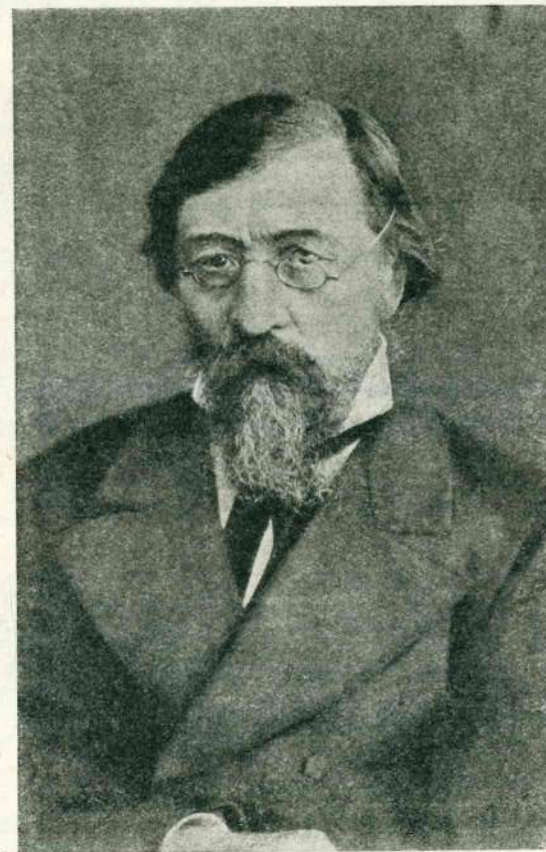
Николай Гаврилович ЧЕРНЫШЕВСКИЙ

хийно-стенографических знаков, мы на этой же странице можем проследить целый ряд сокращений в виде пропуска букв обыкновенного письма. Например, слово «жизнь» у Чернышевского фигурирует в виде «жзь», слово «никогда», как «нд», слово «делать» в виде буквы ять. Далее мы видим замен целых выражений