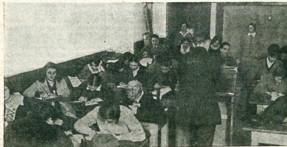
На московском конкурсе на лучшего съездного стенографа СССР

К VIII Всесоюзному съезду нашего союза не должно остаться ни одного комитета стенографов, занимающегося посредническими функциями.